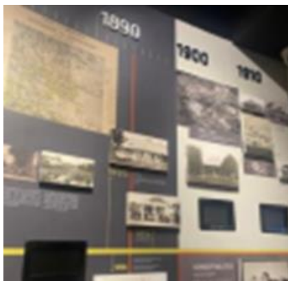
Gambar 1 Informasi Linimasa Pembangunan dan fungsi Gedung Sate

Arsitektur pada gedung ini menjadi salah satu faktor daya tarik untuk para wisatawan karena gedung ini memiliki bentuk yang menjelaskan segala keunikan di dalamnya. Untuk para pengunjung pelajar, hal ini merupakan hal yang sangat menarik untuk dipelajari. Gedung ini bergaya arsitek Indo-Eropa. Didesain untuk struktur tahan gempa, dan terdapat banyak persendian yang menopang sebagai preventif runtuh akibat gempa. Gedung Sate memiliki banyak ruangan dengan berbagai bagian, untuk para pengunjung tidak diperbolehkan untuk memasuki ke berbagai bagian ruangan yang ada pada gedung ini. Bagian utama gedung sate dibuat untuk keperluan utama pemerintah Kota Bandung, sedangkan museumnya sendiri hanya sebagian kecil dari Gedung Sate, yaitu terletak di sisi selatan gedung.