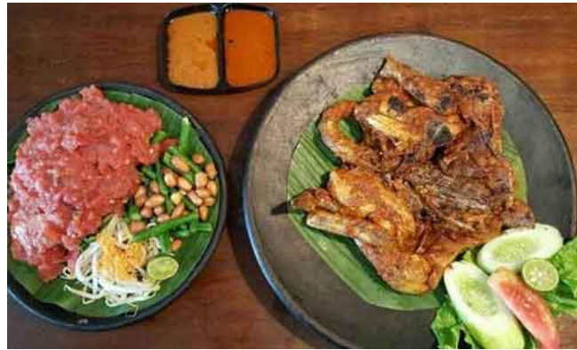
Gambar 1.10 Ayam Taliwang

Kota Mataram Lombok juga memiliki kerajinan Emas dan Mutiara Sekarbela, ini merupakan tempat souvenir khas kota Mataram Lombok. Sekarbela merupakan sebuah desa yang berjarak sekitar 4 kilometer dari kota Mataram. Desa ini sangat terkenal dengan hasil kerajinan mutiaranya. Mutiara-mutiara yang dijual di Sekarbela ini merupakan mutiara hasil budidaya air laut dan air tawar.