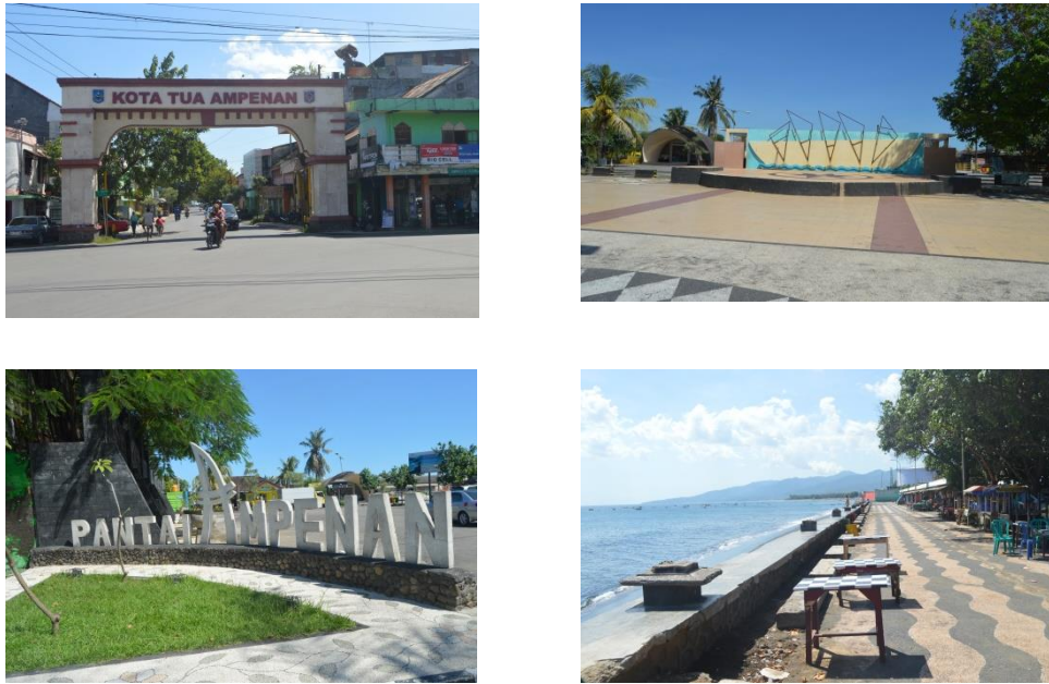
Gambar 1.9 Kota Tua Ampenan Mataram

Kota Tua Ampenan Mataram merupakan bagian unsur Daerah wisata perkotaan (Special Visitor Districts) karena memiliki kombinasi atraksi sebagai daya tarik wisata kota. Kota tua sendiri memiliki bangunan bersejarah peninggalan era Hindia Belanda, bukan saja bangunan berasitektur belanda, banyak gedung bernuansa tiongkok yang masih berdiri sehingga kota tua dapat dikatakan sebagai daya tarik wisata sejarah. Di kota tua Ampenan juga terdapat pantai Ampenan yang menjadi daya tarik wisata alam bagi wisatawan yang berkunjung. Kota tua ampenan juga terdapat kegiatan festival budaya kota tua ampenan dimana dalam acara festival tersebut terdapat atraksi seni budaya, musik, pameran industri kreatif, festival kopi, aneka macam kuliner, pameran foto kota tua tempo doeloe dan parade lintas ethnic. Dengan demikian kawasan kota tua dapat menarik wisatawan untuk berkunjung karena memiliki kombinasi atraksi sebagai penunjang wisata kota di Mataram Lombok.