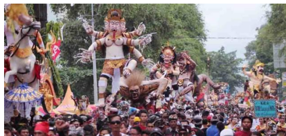
Gambar 1.8 Festival Parade Tahun Baru Caka