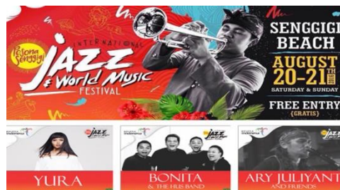
Gambar 1.7 Festival Jazz Di Kota Mataram Lombok

Menurut Ruetsche.J.2006 Festival dan Acara (Festivals and Event) telah menjadi sarana yang semakin populer bagi kota-kota untuk meningkatkan pariwisata. Festival dan Acara (Festivals and Events) dapat berukuran atau berskala besar seperti pada acara pameran dunia atau Olimpiade dan juga acara tahunan Festival Musik Rakyat atau Galeri Malam. Kacamata seperti itu penting, namun, dampaknya terhadap industri wisata kota bergantung pada kehadiran, dan jenis dan jumlah pengunjung dari luar yang hadir pada acara tersebut.