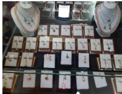
Gambar 1.11 Kerajinan Emas dan Mutiara Sekarbela

Kerajinan Emas dan Mutiara Sekarbela juga merupakan bagian dari unsur Fasilitas Ritel & Katering (Retail and Catering Facilities) dimana toko-toko yang menjual kerajinan Emas dan Mutiara terus tumbuh dan berkembang sehingga berdampak baik pada perekonomian pariwisata perkotaan di Mataram Lombok. Mutiara Sekarbela merupakan ciri khas dari kota Mataram Lombok sehingga pengunjung yang datang bisa menghabiskan banyak waktu dan berbelanja mutiara sebagai souvenir dari kota Mataram Lombok.