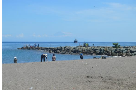
Gambar 1.6 PantaiTanjung Karang dan Makam Loang Baloq

Pantai Tanjung Karang merupakan bagian dari unsur Kawasan Pinggiran Pantai (Waterfronts) karena merupakan kawasan pinggiran pantai sebagai daya tarik wisata alam, letaknya dekat dengan kota Mataram Lombok dan memiliki peluang untuk dikembangkan sebagai daya tarik wisata kota. Selain pantai terdapat juga taman rekreasi Loang Baloq yang memiliki cerita sejarah religi sehingga menjadi daya tarik tersendiri. Dengan demikian Pantai tanjung karang mempunyai peluang untuk meningkatkan perekonomian kota Mataram Lombok dilihat dari jumlah kunjungan wisatawan yang datang ke Pantai Tanjung Karang meningkat tiap tahunnya pada saat liburan, serta berdampak baik bagi masyarakat kota Mataram Lombok karena dengan berkembangnya pariwisata di kota mataram Lombok maka peluang pekerjaan pun terbuka untuk masyarakat setempat.