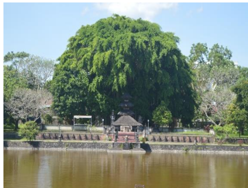
Gambar 1.5 Taman Mayura Lombok

Taman Mayura Lombok merupakan bagian dari unsur Kota Bersejarah (Historic District) dilihat dari bangunan sejarah yang memiliki karakter khas atau karakter lokal dari kota Mataram Lombok. Taman Mayura bisa memberikan pengalaman yang mengesankan pada wisatawan saat berkunjung karena dapat melihat langsung bangunan bersejarah yang terletak di tengah kota, serta merasakan suasana religi karena terdapat pura di area taman mayura. Dengan demikian Taman Mayura mempunyai nilai lebih untuk dijadikan daya tarik wisata kota karena didukung oleh unsur-unsur bangunan bersejarah dan merupakan karakter khas dari kota Mataram Lombok.